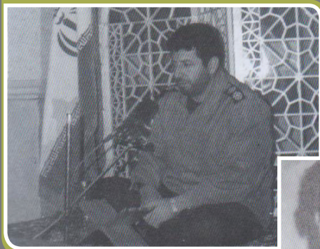
▲ نفر سوم رشته حفظ بیست جزء قرآن کریم نیروهای مسلح جمهوری اسلامی ایران - تهران، آذر ۱۳۷۷