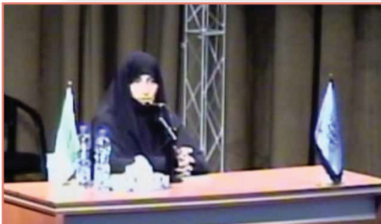
دکتر لاله افتخاری - نماینده مجلس شورای اسلامی

نشست دانشجویی با موضوع "مد و لباس، جوانان و الگوهای پوشش، جذابیت ها محدودیت ها" با همکاری کانون عفاف و حجاب با حضور دکتر لاله افتخاری نماینده مجلس شورای اسلامی روز دوشنبه مورخ ۱۳۹۳/۲/۸ در تالار مولوی برگزار گردید.