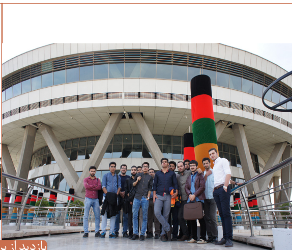
بازدید از برج میلاد