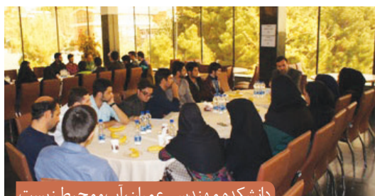
دانشکده مهندسی عمران، آب و محیط زیست