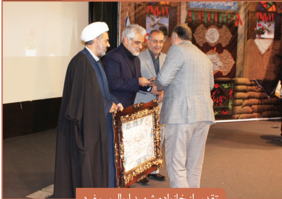
تقدیر از خانواده شهید ابوالپور مفرد