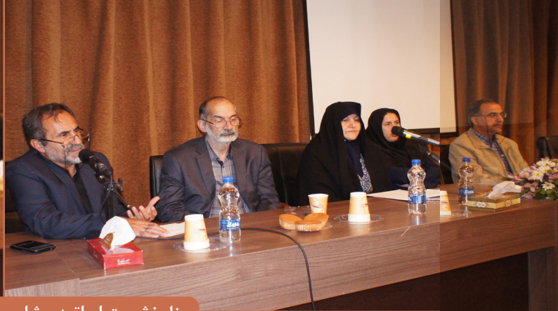
پنل نشست اساتید مشاور و دانشجویان شاهد و ایثارگر