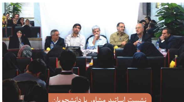
نشست اساتید مشاور با دانشجویان