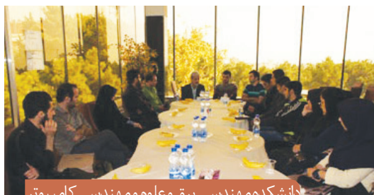
دانشکده مهندسی برق و علوم و مهندسی کامپیوتر