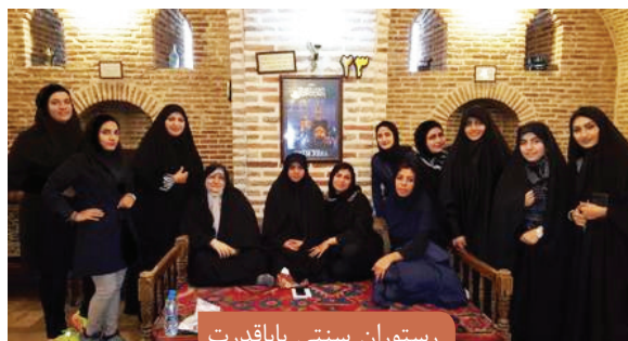
رستوران سنتی بابا قدرت