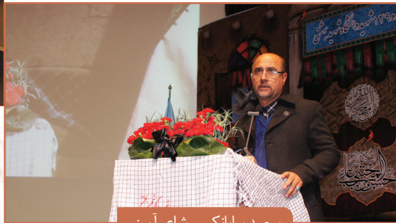
سعید بیابانکی - شاعر آیینی