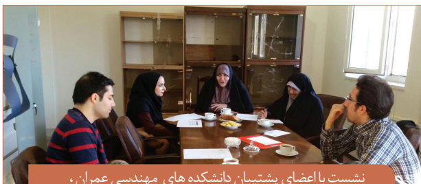
نشست با اعضای پشتیبان دانشکده های مهندسی عمران، مکانیک و برق پردیس شهید عباسپور