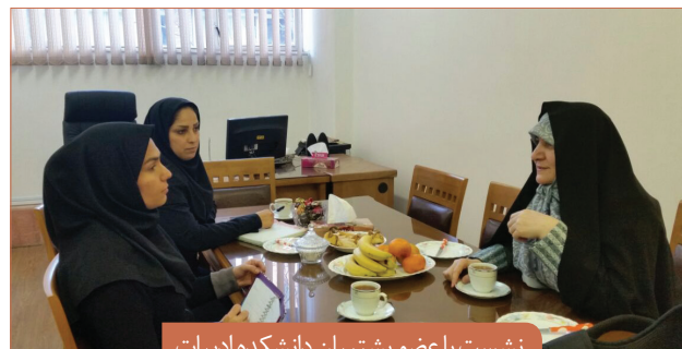
نشست با عضو پشتیبان دانشکده ادبیات