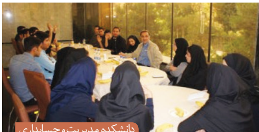
دانشکده مدیریت و حسابداری