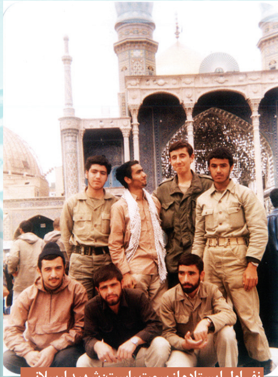
نفر اول ایستاده از سمت راست: شهید ارسلانی