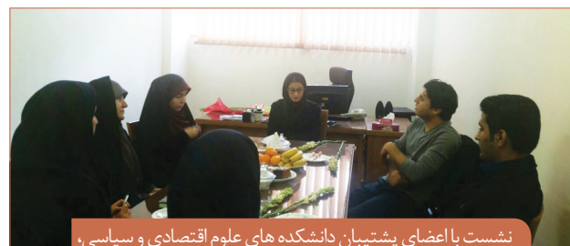
نشست با اعضای پشتیبان دانشکده های علوم اقتصادی و سیاسی، حقوق و مدیریت و حسابداری