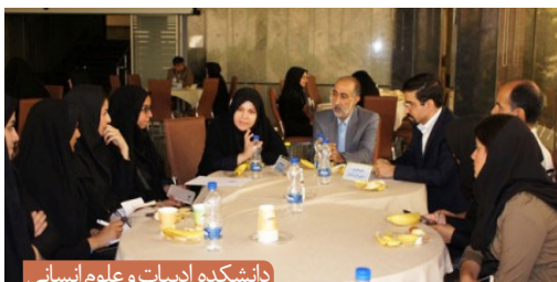
دانشکده ادبیات و علوم انسانی