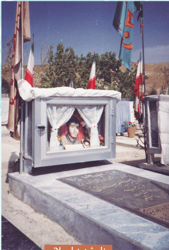
مزار شهید ارسلانی