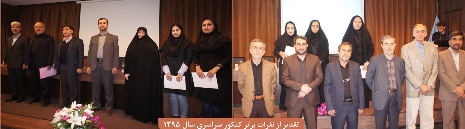
تقدیر از نفرات برتر کنکور سراسری سال ۱۳۹۵