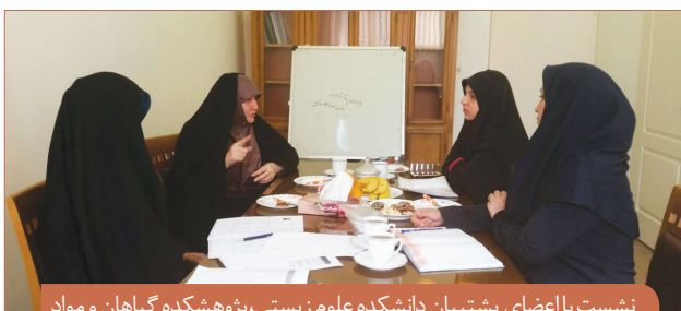
نشست با اعضای پشتیبان دانشکده علوم زیستی، پژوهشکده گیاهان و مواد اولیه دارویی