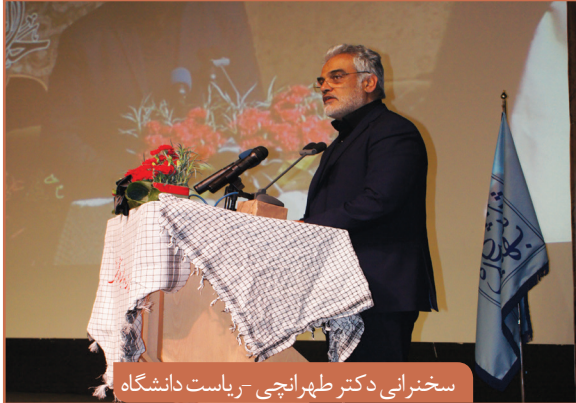
سخنرانی دکتر طهرانچی - ریاست دانشگاه