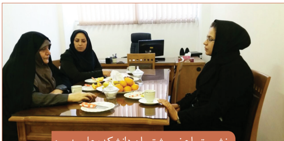
نشست با عضو پشتیبان دانشکده علوم زمین

نشست مشترک مدیر امور شاهد و ایثارگر و اعضای پشتیبان دانشجویان شاهد و ایثارگر به تفکیک دانشکده ها از یکشنبه ۱۴ آذر تا ۱۶ آذر در محل مدیریت امور شاهد و ایثارگر برگزار گردید. هدف این نشست ها بررسی وضعیت تحصیلی دانشجویان شاهد و ایثارگر مقطع کارشناسی قبل از امتحانات و پیشگیری از افت تحصیلی بوده است