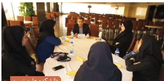
دانشکده علوم زمین