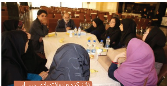
دانشکده علوم اقتصادی و سیاسی