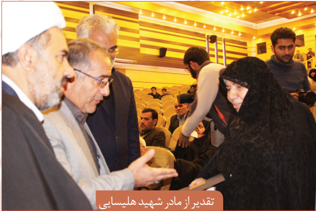
تقدیر از مادر شهید هلیسای