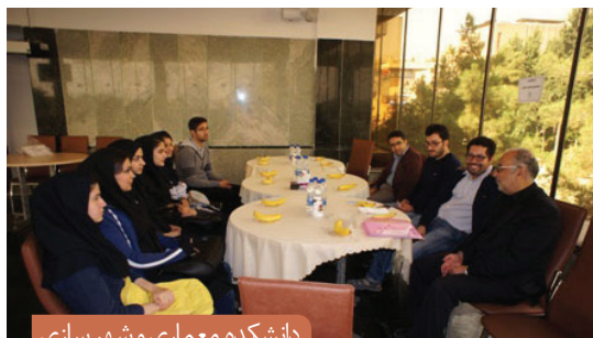
دانشکده معماری و شهر سازی