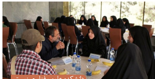
دانشکده علوم و فناوری زیستی